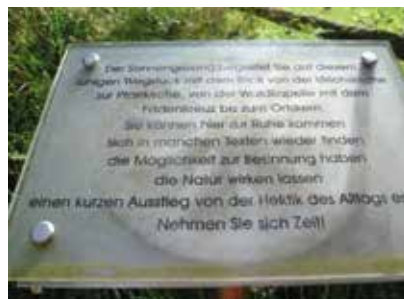
Einstieg in den „Sonnengesang“ auf der Hinterleitn