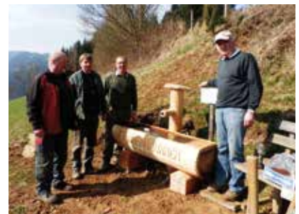
Restaurierung des Sonnenbrunnens