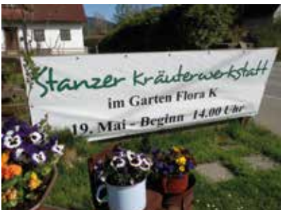
Kräuterwerkstatt im Garten Flora K