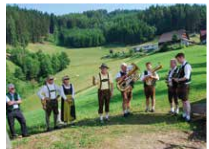
Jubiläum „10 Jahre Sonnenallee 1“

Die ARGE Sonnenweg freut sich, dass der Wanderweg von sehr vielen Gästen und der Stanzer Bevölkerung angenommen wird und die Rückmeldungen äußerst positiv sind. Ein besonderes musikalisches Erlebnis war die Fanwanderung des Wildbach Trios mit ca. 400 Teilnehmern. Besonderer Dank gilt dem hervorragenden, ehrenamtlichen Team der ARGE Sonnenweg!