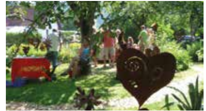
Herzerlkirtag im Garten Flora K