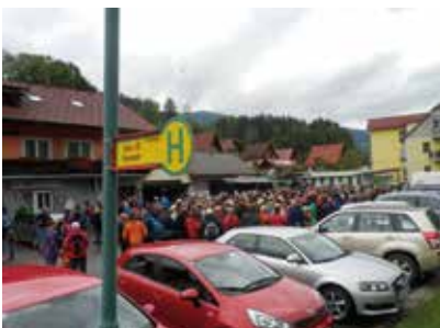
Fanwanderung des Wildbach Trios