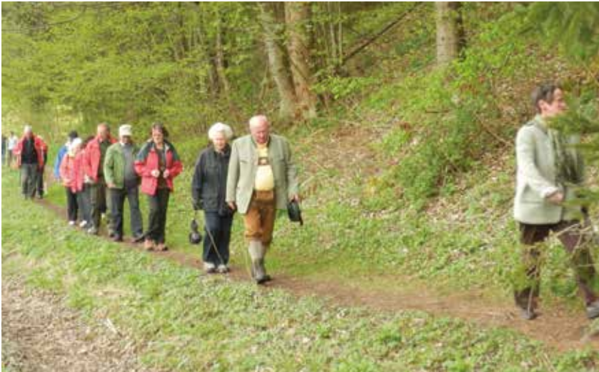
Das Wanderjahr startete mit dem traditionellen „Anwandern“