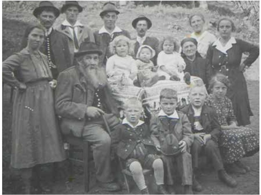
Sommerauerfamilie um 1936

Eine Erklärungsmöglichkeit für diesen außerordentlich hohen